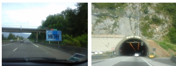
Projection de la manifestation graphique de l'opposition au projet Lyon-Turin sur l'axe autoroutier A43 : un moyen pour accroître l'audience de la revendication. Le message se formalise en reprenant le slogan fédérateur « No TAV » dans une acception générique d'opposition au projet. Photo K. Sutton, juillet 2015.