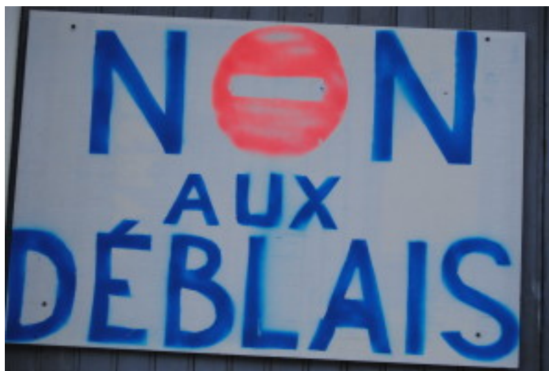
Figure 2. Panneau de manifestation de l'opposition au transit et au stockage des déblais à Villarodin-Le Bourget.