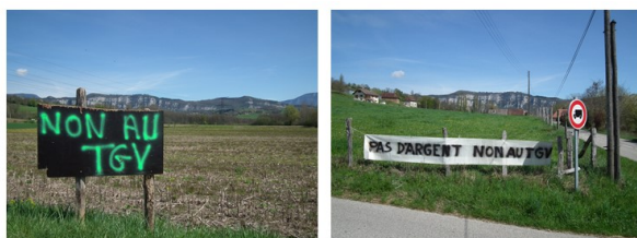
Panneaux contestataires improvisés dans la commune d'Avressieux à l'occasion de l'enquête d'utilité publique de 2012. Photo J. Besson, avril 2012.