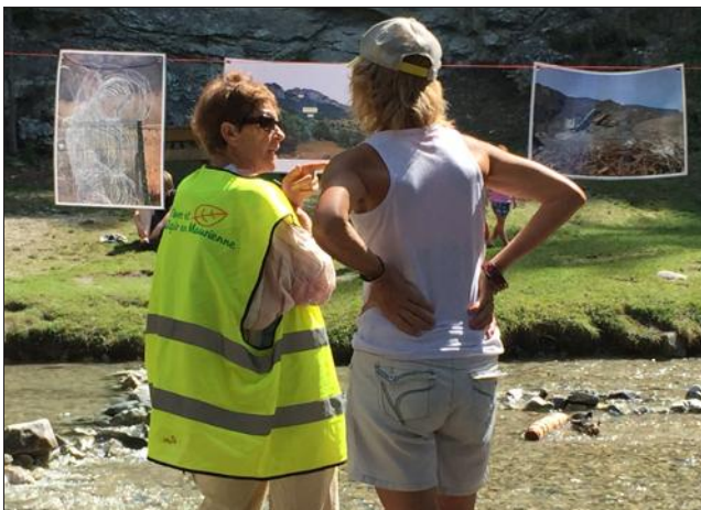
Une expo photo était organisée pour informer les locaux comme les touristes.