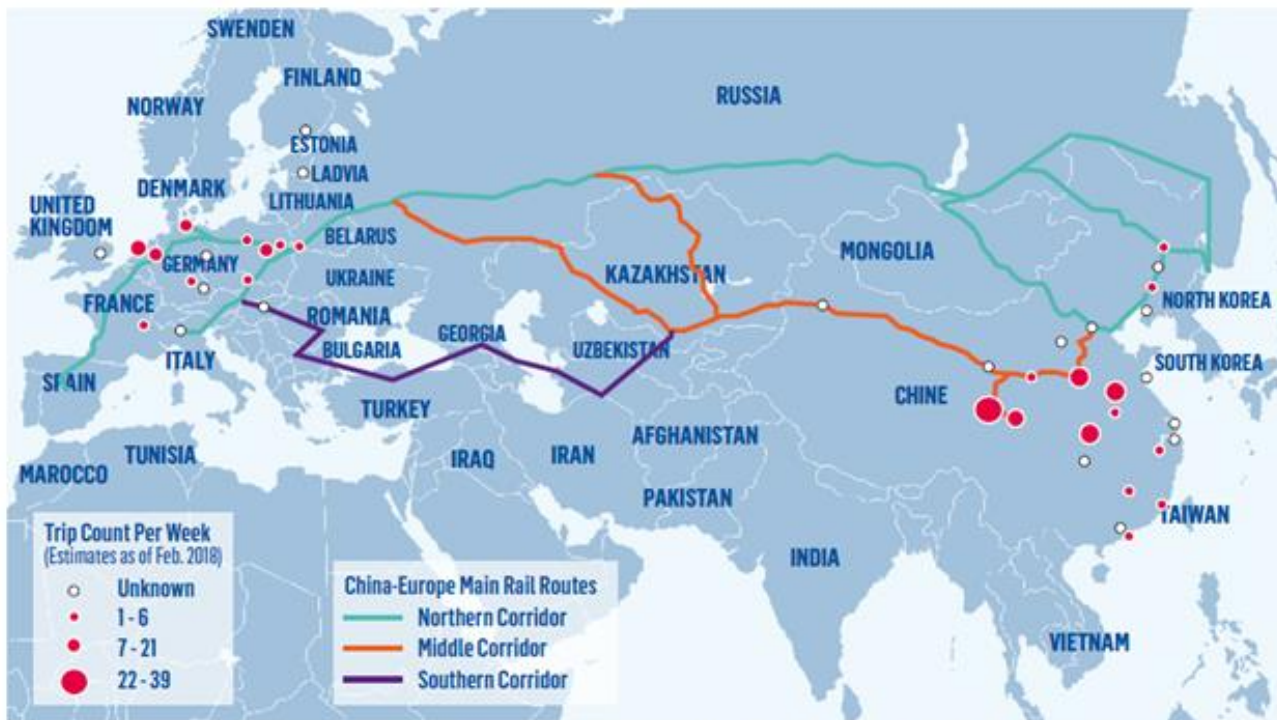
Source : Hillman, J.E. (2018), "The Rise of China-Europe Railways", CSIS, March 6

Une réflexion entre l'État, l'entreprise publique et les industriels français voulant développer leur activité avec la Chine, devrait être menée. Les plates-formes de Dourges et Vénissieux pourraient être développées dans ce sens.