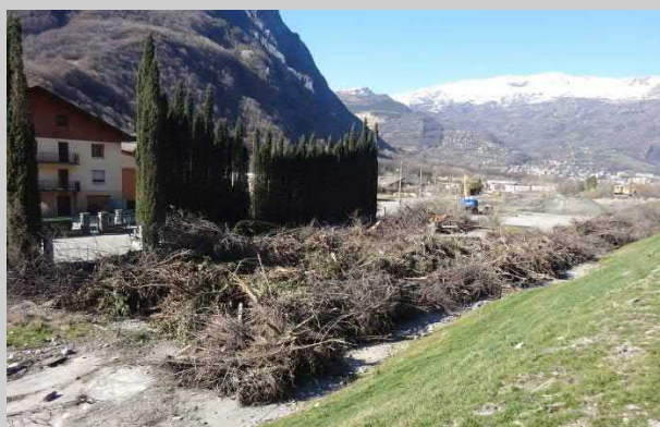
MASSACRE A LA TRONÇONNEUSE

Le site remarquable de la barrière de l'Esseillon saccagé