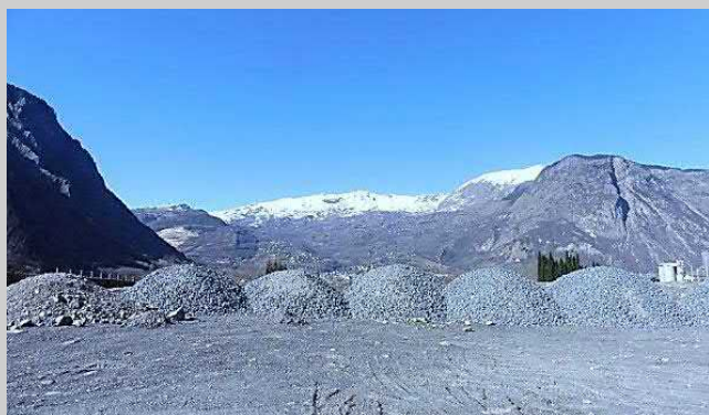
LA MAURIENNE SOUS LES GRAVATS